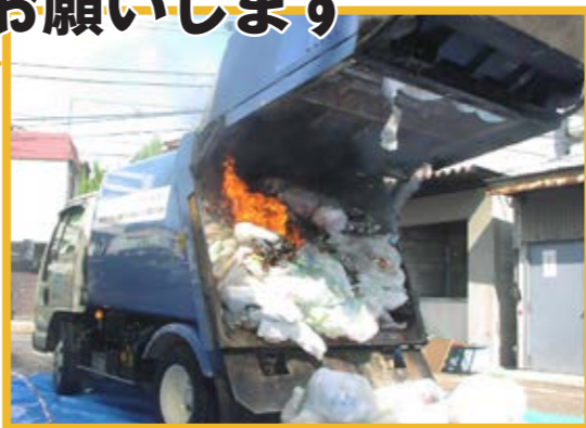
▲清掃車両の火災

不燃ごみの日に、他の不燃ごみとは別の袋に入れて「スプレー缶」「ライター」などと表示して出してください。